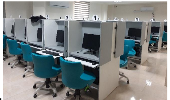
مرکز آزمون الکترونیک

از سالن کنفرانس داخلی ابن سینا با ظرفیت ۸۰ نفر و امکانات سیستم کامپیوتری، ویدیو پروژکتور، پرده نمایش، تجهیزات نمایش فیلم های آموزشی و ... بعنوان سالن اجتماعات بیمارستان استفاده می شود.